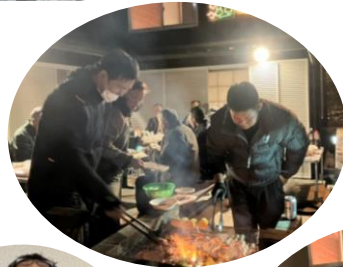
【本社】歳末BBQ・抽選会