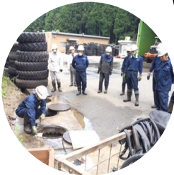
社員研修(10月) 運転手安全教育(年2回)